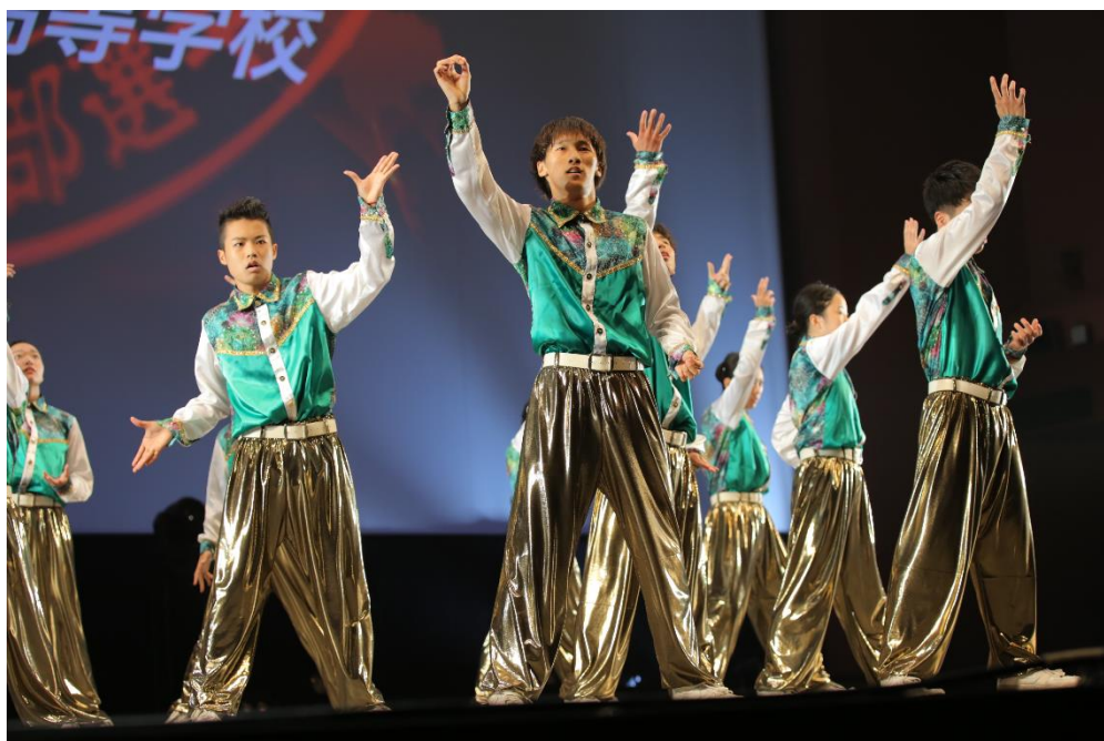
2017年 スモールクラス優勝 大阪府立箕面高等学校

ダンススタジアム大会事務局は、高校ダンス部の日本一を決める大会「第11回 日本高校ダンス部選手権 スーパーカップ DANCE STADIUM」の全国大会を、2018年8月16日（木）、17日（金）の2日間、パシフィコ横浜 国立大ホールにて開催します。